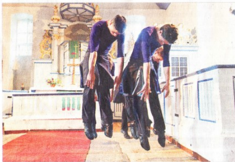
Tanzaufführung in der Kirche des Klosters Hiddensee.

Den findet Bernd Hentschel ganz klassisch während der Auftritte der Palucca-Tänzer auf der Bühne, in seinem Heimatstudio in Karlsruhe oder dort, wo Fotograf und Protagonisten eine spannende Kulisse entdecken. Vor Gebirgszügen, in Industrieruinen oder in Kirchen. „Das ist mir am liebsten, weil wir sehr kreativ und überraschend sein können.“ Experimente fordern Bernd Hentschel nicht nur als Fotograf heraus. Hauptberuflich ist er Bauingenieur und untersucht wassertechnische Abläufe zum Teil auch mit der Kamera. Fotos, die zwischen 2009 und 2013 auf Hiddensee aufgenommen wurden, stellt er zurzeit in der Palucca Hochschule für Tanz aus. Die Schau ist zwar nicht öffentlich, doch eine Auswahl ist hier zu sehen.