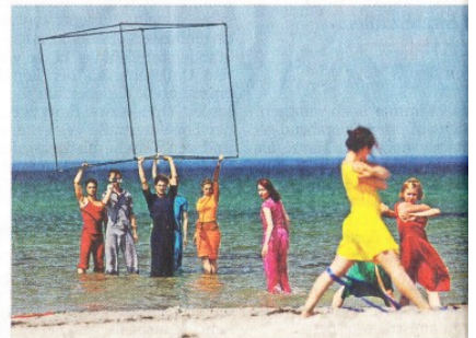
Tanzperformances der Bachelor-Studenten an der Ostsee.